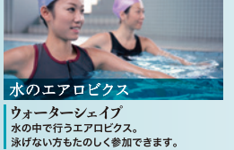
水のエアロビクス ウォーターシェイプ 水の中で行うエアロビクス。泳げない方もたのしく参加できます。