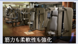
筋力も柔軟性も強化 キネシス ケーブルを多方向に動かすことで、200種類以上のトレーニングができます。