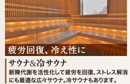
疲労回復、冷え性に サウナ&冷サウナ 新陳代謝を活性化して疲労を回復、ストレス解消にも最適な広々サウナ。冷サウナもあります。