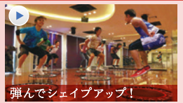
弾んでシェイプアップ! UBOUND (ユーバウンド) 音楽に合わせてトランポリンで弾むだけ! 体幹や下半身をしっかりと鍛えます。