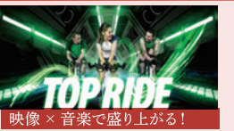
映像 × 音楽で盛り上がる! TOP RIDE (トップライド) プロジェクションとコラボした演出にワクワク! 自転車だから初心者でも簡単。ガッツリ脂肪燃焼。