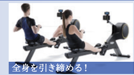
全身を引き締める! ボートマシン「スキルロウ」 関節への負担を抑えながら、筋力と有酸素運動ができます。