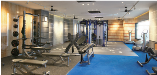
マシンジム 東北最大級 大きいだけじゃない! 一人ひとりに「最適」がある!