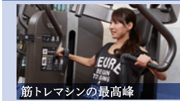
筋トレマシンの最高峰 ストレングスマシン(ARTIS) 「瘦せ体質」と「美しい姿勢」は筋力アップから。効率よく筋力トレーニングができます。