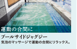
運動の合間に プールサイドジャジー 気泡のマッサージで運動の合間にリラックス。