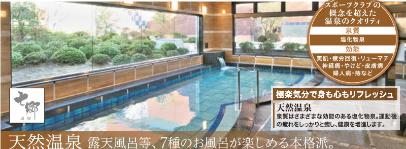
天然温泉 露天風呂等、7種のお風呂が楽しめる本格派。