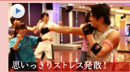
思いっきりストレス発散! FHHGT DO (ファイドフ) あらゆる格闘技の要素を盛り込んだダイナミックな動きで、たっぷり脂肪燃焼。