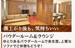
湯上がり後も、気持ちいい パウダールーム&ラウンジ ゆとりあるパウダールームで身支度。上質なソファでご休憩もどうぞ!

スポーツクラブの概念を超えた温泉のクオリティ 泉質 塩化物泉 効能 美肌・疲労回復・リウマチ 神経痛・やけど・皮膚病 婦人病・痔など