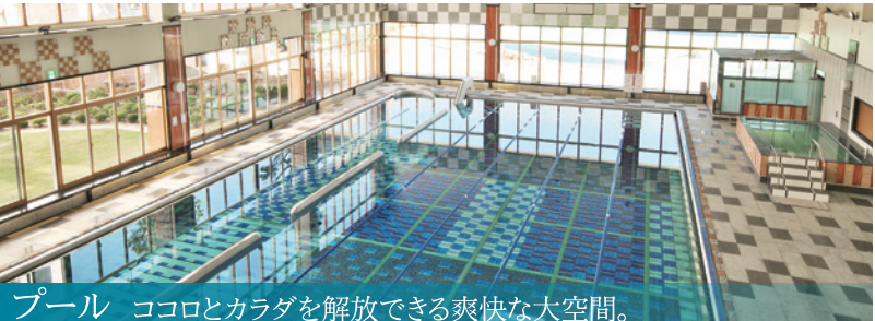
プール ココロとカラダを解放できる爽快な大空間。

2ヶ月集中コース、通い放題 97,500円(税込107,250円) パーソナルトレーニング 全18回 なんと1回あたり 5,416円(税込6,000円) 2ヶ月集中コース 88,000円(税込96,800円) パーソナルトレーニング 全18回 なんと1回あたり 4,888円(税込5,400円)