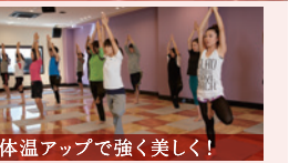
体温アップで強く美しく! 岩盤ホットヨガ 体験実施中! 血流を促進、代謝が向上することで、痩せやすく免疫力のあるカラダへ。