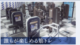
誰もが楽しめる筋トレ シニア&ビギナーコーナー ボタンで簡単にウイト調整。初心者やシニアにも安心な筋トレコーナー。