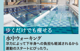
歩くだけでも痩せる 水中ウォーキング 浮力によって下半身への負担も軽減されるから運動のスタートにぴったり。