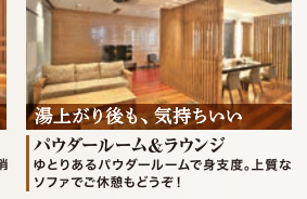
湯上がり後も、気持ちいい パウダールーム&ラウンジ ゆとりあるパウダールームで身支度。上質なソファでご休憩もどうぞ!

スポーツクラブの概念を超えた温泉のクオリティ 泉質 塩化物泉 効能 美肌・疲労回復・リウマチ 神経痛・やけど・皮膚病 婦人病・痔など