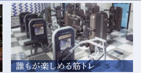
誰もが楽しめる筋トレ シニア&ビギナーコーナー ボタンで簡単にウエイト調整。初心者やシニアにも安心な筋力トレーナー。