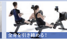
全身を引き締める! ボートマシン「スキルロウ」 関節への負担を抑えながら、筋力と有酸素運動ができます。