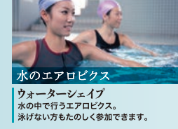
水のエアロビクス ウォーターシェイプ 水の中で行うエアロビクス。泳げない方もたのしく参加できます。