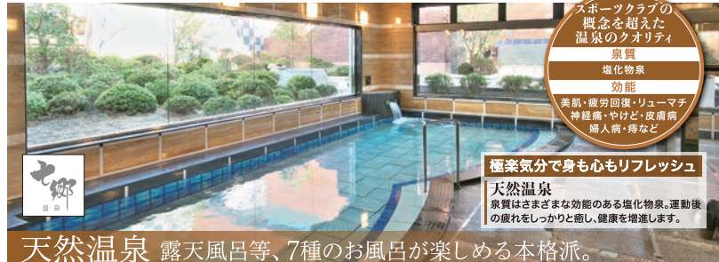
天然温泉 露天風呂等、7種のお風呂が楽しめる本格派。