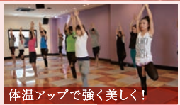
体温アップで強く美しく! 岩盤ホットヨガ 体験実施中! 血流を促進、代謝が向上することで、痩せやすく免疫力のあるカラダへ。