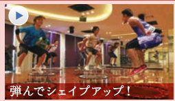
弾んでシェイプアップ! UBOUND (ユーバウンド) 音楽に合わせてトランポリンで弾むだけ! 体幹や下半身をしっかりと鍛えます。