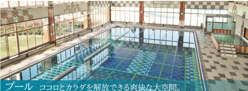
プール ココロとカラダを解放できる爽快な大空間。

2ヶ月集中コース、通い放題 97,500円(税込107,250円) パーソナルトレーニング 全18回 なんと1回あたり 5,416円(税込6,000円) 2ヶ月集中コース 88,000円(税込96,800円) パーソナルトレーニング 全18回 なんと1回あたり 4,888円(税込5,400円)