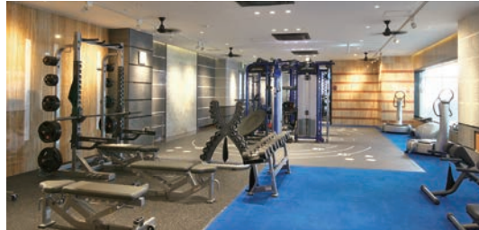
マシンジム 東北最大級 大きいだけじゃない! 一人ひとりに「最適」がある!