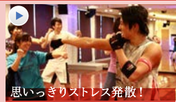
思いっきりストレス発散! FIGHT DO (ファイトド) あらゆる格闘技の要素を盛り込んだダイナミックな動きで、たっぷり脂肪燃焼。