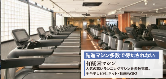
先進マシン多数で待たされない! 有酸素マシン 人気の高いランニングマシンを多数完備。全台テレビ付、ネット・動画もOK!