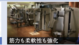
筋力も柔軟性も強化 キネシス ケーブルを多方向に動かすことで、200種類以上のトレーニングができます。