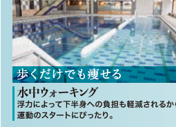
歩くだけでも痩せる 水中ウォーキング 浮力によって下半身への負担も軽減されるから運動のスタートにぴったり。