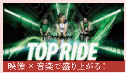
映像 × 音楽で盛り上がる! TOP RIDE (トップライド) プロジェクションとコラボした演出にワクワク! 自転車だから初心者でも簡単。ガッツリ脂肪燃焼。