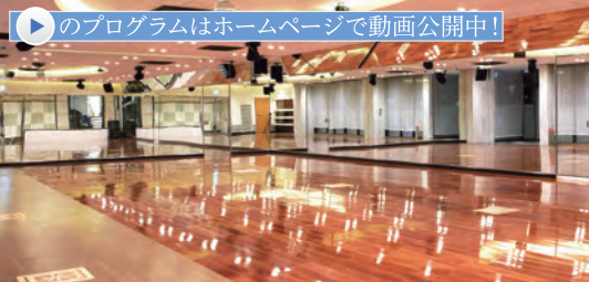
スタジオ 多彩なプログラムで楽しくボディメイク!