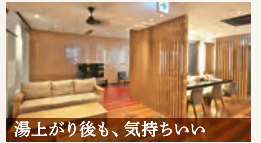
湯上がり後も、気持ちいい

サウナ&冷サウナ 新陳代謝を活性化して疲労を回復、ストレス解消にも最適な広々サウナ、冷サウナもあります。