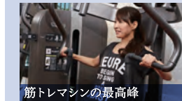
筋トレマシンの最高峰

ストレングスマシン(ARTIS) 「瘦せ体質」と「美しい姿勢」は筋力アップから。効率よく筋力トレーニングができます。