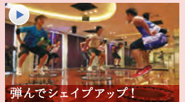
弾んでシェイプアップ!

FIHGT DO (ファイド) あらゆる格闘技の要素を盛り込んだダイナミックな動きで、たっぷり脂肪燃焼。