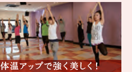
体温アップで強く美しく!

TOP RIDE (トップライド) プロジェクションとコラボした演出にワクワク! 自転車だから初心者でも簡単。ガッツリ脂肪燃焼。