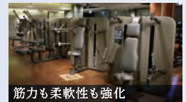
筋力も柔軟性も強化

ボートマシン「スキルロウ」 関節への負担を抑えながら、筋トレと有酸素運動ができます。