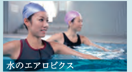
水のエアロビクス

水中ウォーキング 浮力によって下半身への負担も軽減されるから運動のスタートにぴったり。