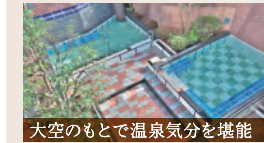
大空のもとで温泉気分を堪能

天然温泉 泉質はさまざまな効能のある塩化物泉。運動後の疲れをしっかりと癒し、健康を促進します。