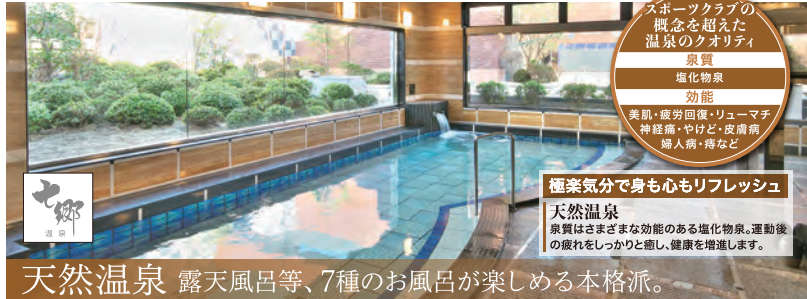
天然温泉 露天風呂等、7種のお風呂が楽しめる本格派。

シニア&ビギナーコーナー ボタンで簡単にウエイト調整。初心者やシニアにも安心な筋トレコーナー。