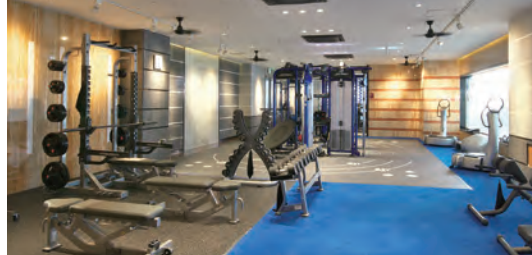
マシンジム 東北最大級 大きいだけじゃない!一人ひとりに「最適」がある!

ウォーターシェイプ ウォーターシェイプ 水の中で行うエアロビクス。泳げない方もたのしく参加できます。