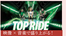
映像 × 音楽で盛り上がる!

UBOUND (ユーバウンド) 音楽に合わせてトランポリンで弾むだけ! 体幹や下半身をしっかりと鍛えます。