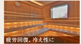
疲労回復、冷え性に

露天風呂 血行を促進、疲労回復や美肌づくりに効果的な炭酸泉風呂、靄風呂や石風呂もあります。