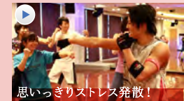
思いっきりストレス発散!

FIHGT DO (ファイド) あらゆる格闘技の要素を盛り込んだダイナミックな動きで、たっぷり脂肪燃焼。