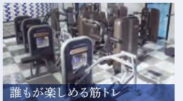
誰もが楽しめる筋トレ

キネシス ケーブルを多方向に動かすことで、200種類以上のトレーニングができます。