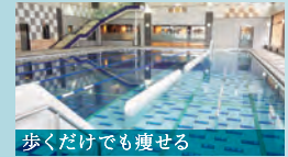
歩くだけでも痩せる

水中ウォーキング 浮力によって下半身への負担も軽減されるから運動のスタートにぴったり。