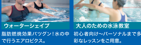
ウォーターシェイプ 脂肪燃焼効果バツグン！水の中で行うエアロビクス。 大人のための水泳教室 初心者向け～パーソナルまで多彩なレッスンをご用意。

天然石を贅沢に使ったプールはウォーキング専用レーンも完備。水中ウォーキングから始めたい方にも最適です。