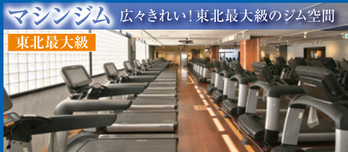
マシンジム 広々きれいな東北最大級のジム空間 東北最大級

筋トレや有酸素マシンを中心に、100台を超える先進マシンがずらり！女性専用コーナーや初心者コーナーも完備。