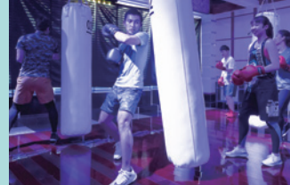
暗闇ボクシング 「暗闇×圧倒的サウンド」で、エクササイズに没入できる。