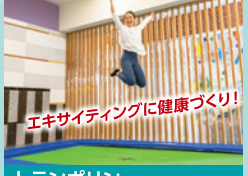
トランポリン エキサイティングに健康づくり！ 楽しく弾んで気分転換！体幹や下半身の強化にも。