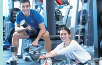
ウェイトトレーニング フリーウエイトトラックも充実。上級者にも満足いただけるコーナーを備えています。