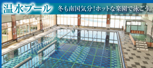
温水プール 冬も南国気分！ホットな楽園で泳ごう。

天然石を贅沢に使ったプールはウォーキング専用レーンも完備。水中ウォーキングから始めたい方にも最適です。