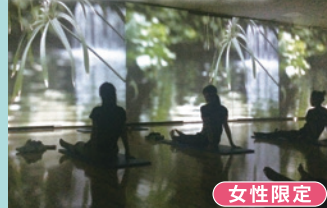
プロジェクションヨガ 幻想的な映像と音楽がヨガの効果を高め、心身を癒します。 女性限定