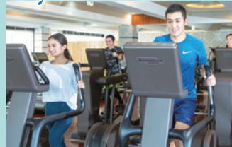
有酸素トレーニング 一流マシンを多数完備。寒い朝も深夜も、雨や雪の日も、安全に快適に走れます。