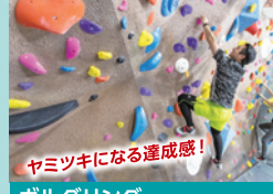
ボルダリング ヤミツキになる達成感！ 東京五輪でも話題となった競技が気軽に楽しめる。