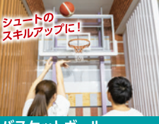
バスケットボール シュートのスキルアップに！ ゴール下のシュートドリルなどが気軽に楽しめます。