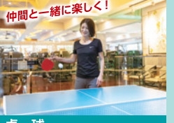
卓球 一人でできる自動卓球機完備！仲間と打ち合うもよし！