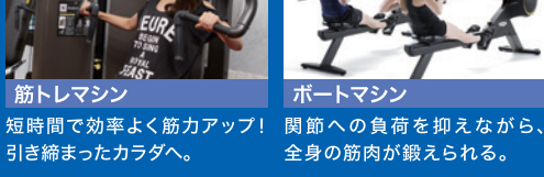
筋トレマシン 短時間で効率よく筋力アップ！引き締まったカラダへ。 ボートマシン 関節への負荷を抑えながら、全身の筋肉が鍛えられる。

筋トレや有酸素マシンを中心に、100台を超える先進マシンがずらり！女性専用コーナーや初心者コーナーも完備。