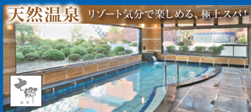
天然温泉 リゾート気分を楽しめる、極上スパ！

疲労回復や美肌など、さまざまな効能ある七郷温泉を導入。7種類のお風呂で疲れを癒して、ますます元気！