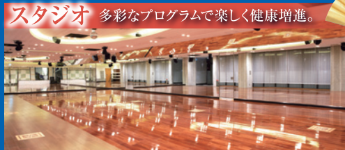
スタジオ 多彩なプログラムで楽しく健康増進。

目的に合わせて3つのスタジオを完備。ヨガ、ダンスから格闘技系まで、健康効果の高いプログラムが楽しめます。