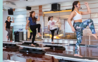
サーフエクササイズ 体幹やバランス力を強化して、美しい姿勢やボディラインに。