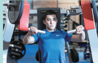
筋力トレーニング 定番マシンはもちろん、希少マシンも設置。通常のジムを超えた充実のラインナップ。