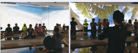
ユニバーサルヨガ体験会風景