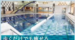
歩くだけでも痩せる

水中ウォーキング 浮力によって下半身への負担が軽減されるから運動のスタートにぴったり。