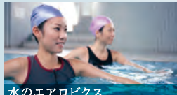
水のエアロビクス

水中ウォーキング 浮力によって下半身への負担が軽減されるから運動のスタートにぴったり。