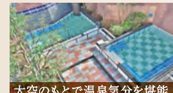
大空のもとで温泉気分を堪能

露天風呂 血行を促進、疲労回復や美肌づくりに効果的な炭酸風呂。寝風呂や石風呂もあります。