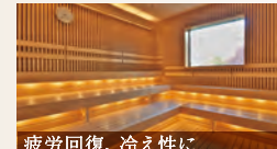
疲労回復、冷え性に

露天風呂 血行を促進、疲労回復や美肌づくりに効果的な炭酸風呂。寝風呂や石風呂もあります。