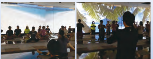
ユニバーサルヨガ体験会風景