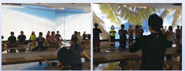
ユニバーサルヨガ体験会風景