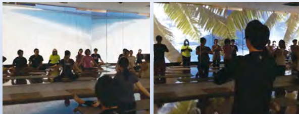
ユニバーサルヨガ体験会風景