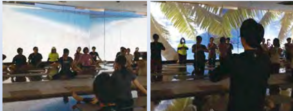
ユニバーサルヨガ体験会風景