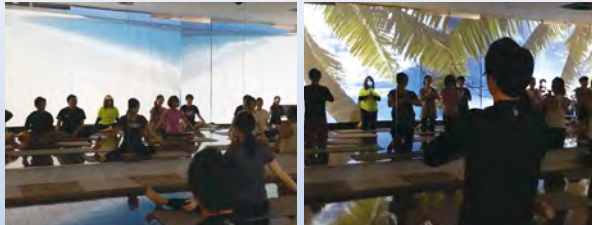
ユニバーサルヨガ体験会風景