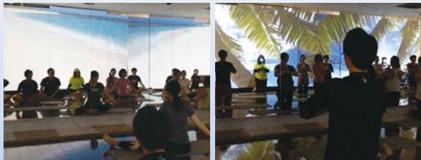
ユニバーサルヨガ体験会風景