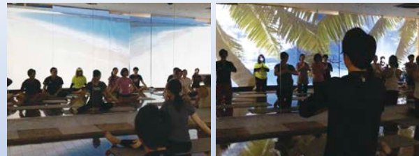
ユニバーサルヨガ体験会風景