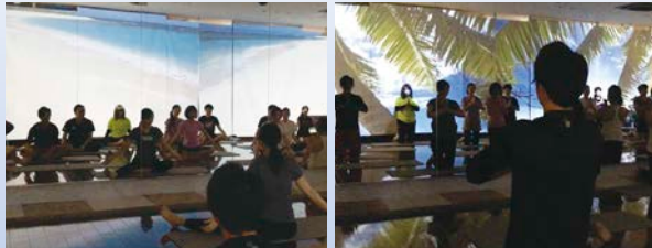
ユニバーサルヨガ体験会風景