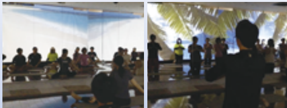
ユニバーサルヨガ体験会風景