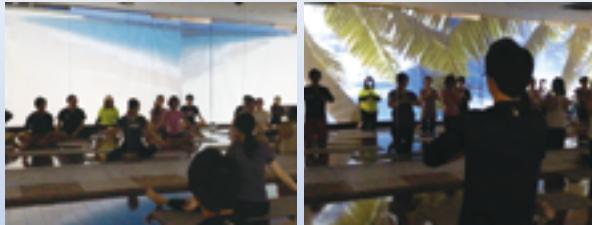
ユニバーサルヨガ体験会風景